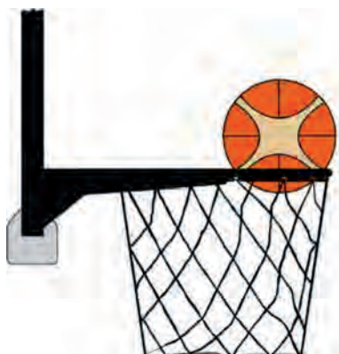
Diagrama 3 - Balón dentro de la canasta