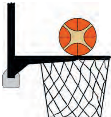
Diagrama 2 - Balón en contacto con el aro