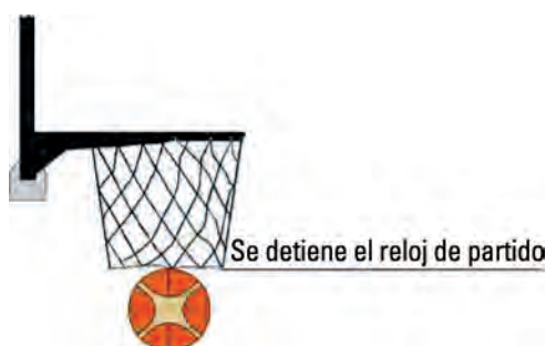
Diagrama 1 - Canasta convertida.

16-10 Ejemplo: Al inicio de un cuarto, el equipo A está defendiendo su canasta cuando B1 regatea por error hacia su propia canasta y logra un cesto.